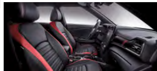
Tapicerka skórzana w kolorze burgund