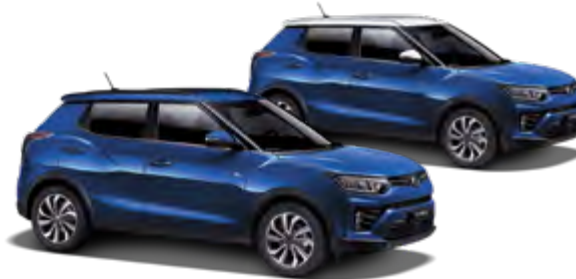
Dandy Blue (metal.)