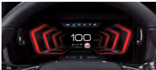
10,25" wyświetlacz LCD HD