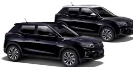
Space Black (metal.)