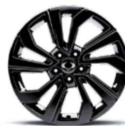
18" felgi aluminiowe czarne "diamentowe" (215/50)