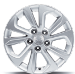
16" felgi aluminiowe (205/65)