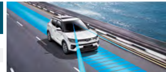
LDWS/LKAS – asystent pasa ruchu