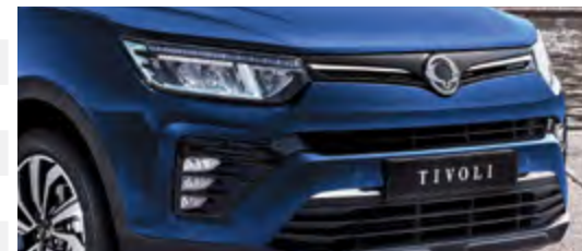
Światła mijania/drogowe LED