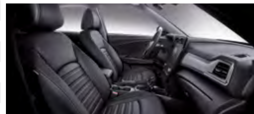
Tapicerka skórzana w kolorze czarnym