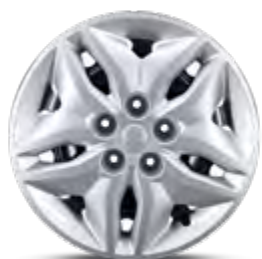
16" felgi stalowe z kołpakami (205/65)