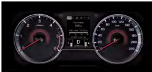
3,5" LCD – wyświetlacz komputera pokładowego