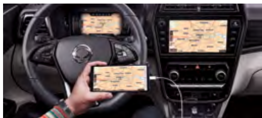
Dual Navi/ Android Auto/ Apple CarPlay