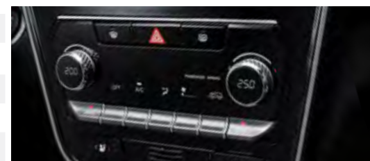
Klimatyzacja automatyczna dwustrefowa