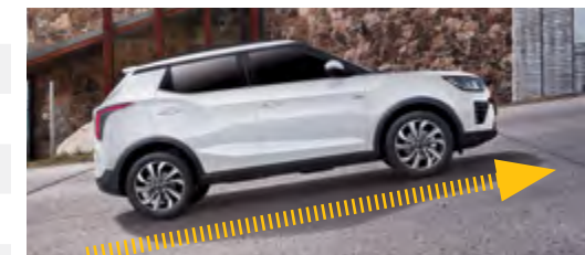
HSA – asystent wjazdu na wzniesienia