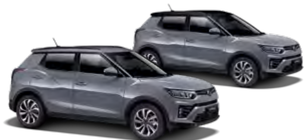
Platinum Gray (metal.)