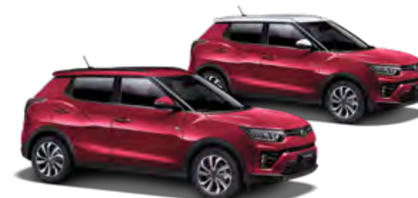
Cherry Red (metal.)