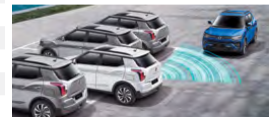
RCTA – radar ruchu poprzecznego