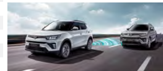
BSD - system ostrzegania o pojazdach w martwym polu lusterek