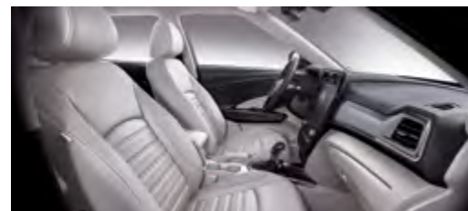
Tapicerka skórzana w kolorze jasno-szarym