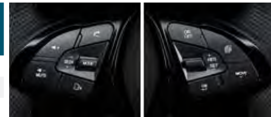
Tempomat i zestaw głośnomówiący