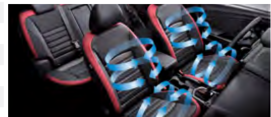
Wentylowane fotele z przodu