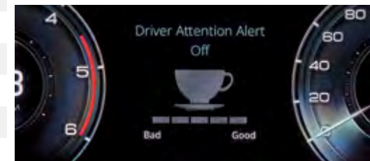
DAA – asystent zmęczenia kierowcy