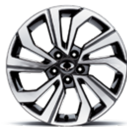
18" felgi aluminiowe "diamentowe" (215/50)